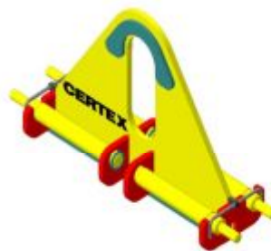
ПМ 1023 Р