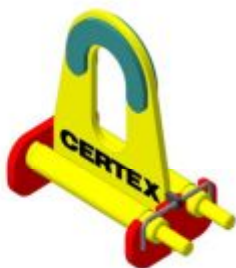
ПМ 524 Р

Расчетный срок службы при односменной работе 10 лет.